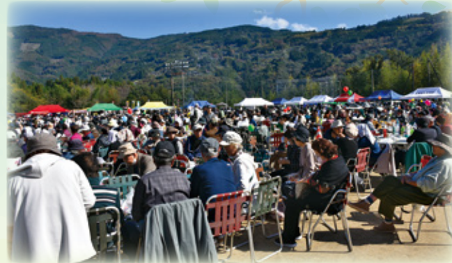
▲多くの来場者で大盛況