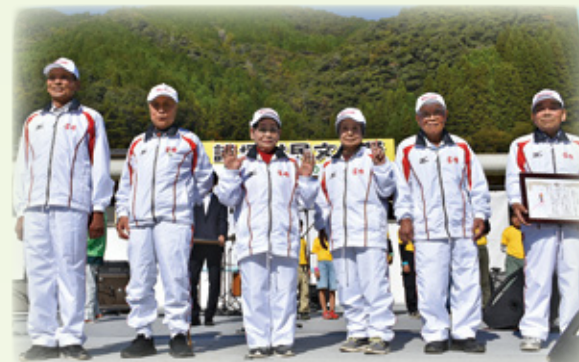
▲いつまでも元気で！～スポーツ功労賞～