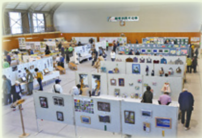
▲村民体育館での展示