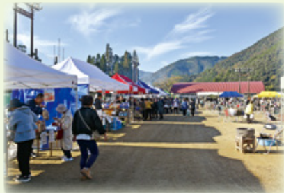
▲公民館コーナーも賑わいました！