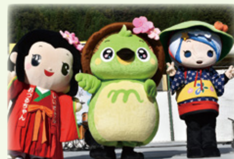
もろっぴい初披露目！