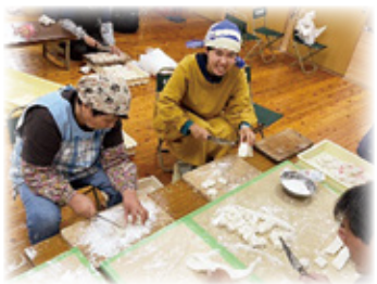
小原井祭りのおせんまい作り

諸塚村に来て9ヶ月目に突入しました。11月は木々が紅葉し始めたり、雲海をよく見た気がします。この1ヶ月は秋祭り（おせんまい作り、清掃、教養講座等）、蜂蜜採り、浄覚寺コンサート、消防団訓練、駄賃つけ唄大会、村民文化祭（ちまき・餅作り）、成牛市のお手伝いをさせていただきました。秋祭りでは小原井と七ツ山で白太鼓、桂では桂神楽を見学する事が出来ました。小原井の白太鼓では早朝の鐘鳴らしにも参加させていただき、高校生を含めた若手が担っており、伝統を受け継ぐ姿が羨ましく感じました。 蜂蜜採りではニホンミツバチについて教えてもらいながら、最後は自分で巣箱から蜂蜜を採取させていただきました。巣箱に蜂が入ること自体が難しいにも関わらず、蜂蜜を採取するまでも別の蜂に乗っ取られるリスクもあると聞き、蜂蜜を採取出来ること自体がかなり貴重だということを確認しました。 また干し柿作りにも挑戦中です。大阪でも作っていました、排気ガスの臭いが付いたりしたので、綺麗な空気の中でどんな味になるか楽しみです。 年末年始は諸塚で過ごす予定なので、年の暮れや正月の風習をぜひお教えてほしいです。今年もあと僅かですが、よろしく願います。