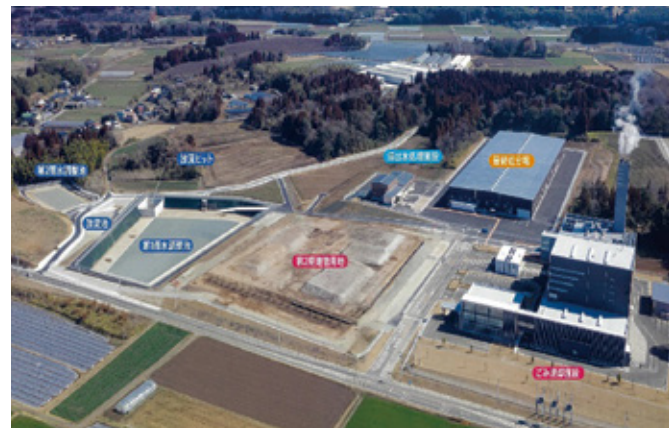
▲クリーンの森合志 全景(パンフレットより)