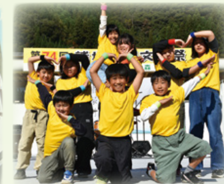
▲入賞おめでとう！～スポーツ賞～