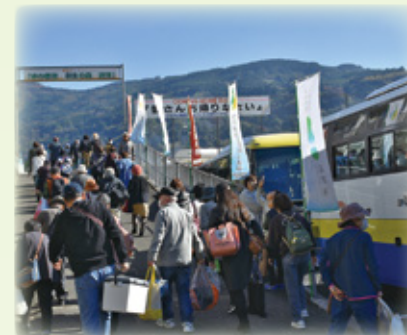
▲ふるさとバス到着！皆さんお帰りなさい！

来場者の皆様のおかげで盛大に開催できました。ありがとうございました。(企画創生課)