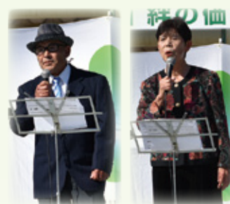
▲熟練の歌～コスモス会～