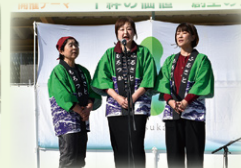
▲諸塚民謡会の民謡の披露