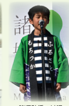
▲諸塚駄賃つけ唄(有声の部優勝者)の披露