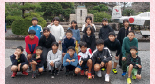
▲「知覧特攻平和会館」にて