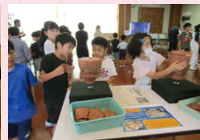
▲土器復元パズルに挑戦!!