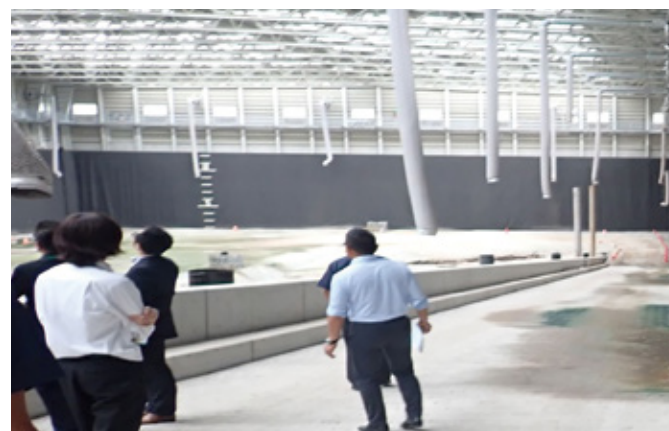
▲処分場内部視察時の様子

これまでの各検討委員会の会議資料や会議録を広域連合のホームページに公表しています。ぜひ、ご覧ください。