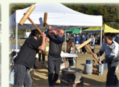
▲みんなの力で～ふれあい餅つき～