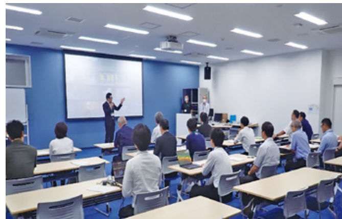
▲会議室での映像研修及び意見交換会の様子