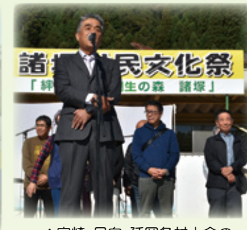
▲宮崎・日向・延岡各村人会の皆さまのごあいさつ