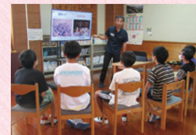
▲弥生時代の住居についての説明を聞く6年生

また、17日(金)は、県埋蔵文化財センターの職員による「埋文体験講座」を実施しました。6年生は、「弥生時代の住居」の説明を受け、授業の学びをさらに深めることができました。全学年を対象にたくさんの体験活動が準備されていました。狩猟疑似体験をおこなったり、弥生土器の復元パズル等に挑戦したりしました。そして何より、土器や石器など当時の生活用品の「本物」にふれる貴重な体験ができました。子どもたちの活動を支えてくださった多くの方々に、心より感謝申し上げます。ありがとうございました。