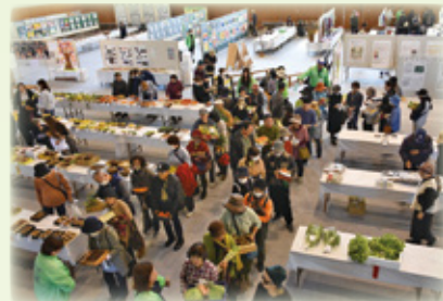
▲大盛況！産業共進会の出品物即売会