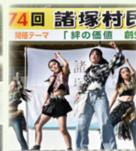
▲Bell Designによる多彩なパフォーマンス