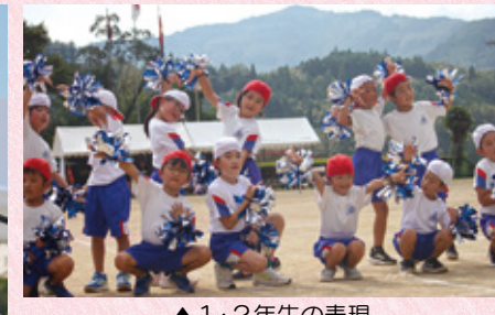
▲1・2年生の表現 「もろっこアドベンチャーはいポーズ」