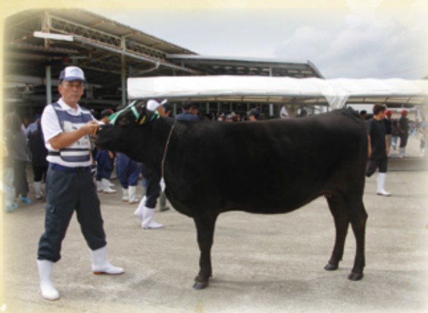
第2類(生後17ヶ月以上22ヶ月未満)

令和7年10月3日〜4日に、都城市家畜市場において第66回宮崎県畜産共進会が開催されました。本村から郡代表牛として3頭が出品されました。結果は以下のとおりです。