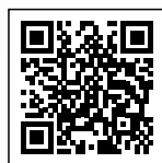
▲届出はこちらから

☒社会福祉法人宮崎県社会福祉協議会 宮崎県福祉人材センター TEL:0985-32-9740 FAX:0985-27-0877