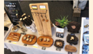
諸塚村の黒文字・ケヤキ・マツ・クヌギ・コナラ・スギを移動販売の商品に