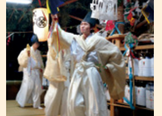
神楽など複数の地区で伝統芸能に参加させてもらっています