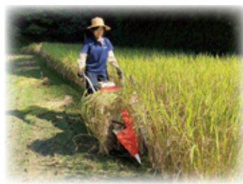
稲刈りでのバインダー体験

諸塚村に来て8ヶ月目に突入しました。10月は道にどんぐりが落ちていたり、柿が色づいているのを見て季節の移り変わを感じました。 この1ヶ月はもろつか健康生きがいくつりフェスタ・牛洗い・へべす収穫・落花生収穫・稲刈り・やかた婦人のお手伝いをさせていただきました。 健康フェスタでは私の活動内容や諸塚に来て驚いたこととお話させていただきました。フェスタ後に知り合った方からも「フェスタ見てたよ!」とお声を掛けていただくことも多く、とてもありがたいです。 10月半ばには人生初の稲刈りを手伝わせていただきました。5箇所にお手伝いに行きましたが、稲の結束方法は人や地域によってやり方がそれぞれで、そこが面白かったです。作業中は非常に暑く、かなり体力を使う仕事だとも痛感しました。 また、魚寿司や灰汁巻きの作り方も教わりました。灰汁巻きを巻いてい