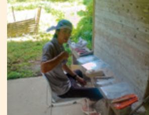
面打ち。神楽文化継承と木工技術習得を目指します

もう一つは「受け皿」となることです。自分と同じく諸塚に魅力を感じる人はいます。しかし住むところも働く場所も乏しく、よそから来るには壁が高いのが現状です。そんな人たちの受け皿として受け入れ、究極自分のところで雇い住まわす、そんなことが一個人、事業体でできたらどれほど素敵かと夢見ています。