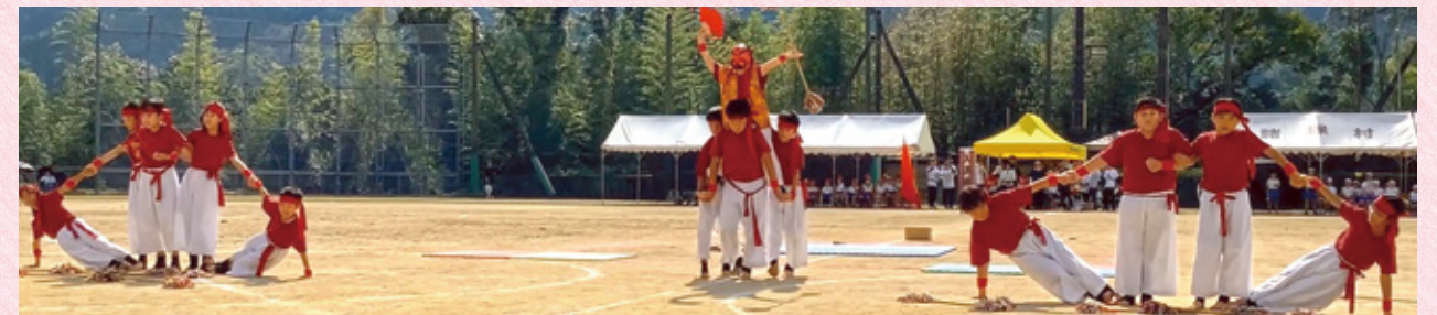
▲5・6年生の表現。「諸小ふるさと神楽」