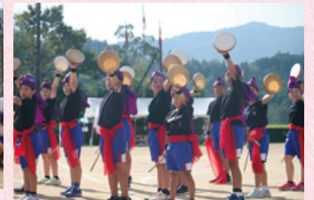
▲「諸小ダイナミック2025」(3・4年)