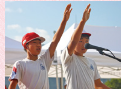
▲運動会を盛り上げた6年生団長

今回、諸塚幼稚園との最後の合同運動会となりましたが、来賓の方々をはじめ、ご来場いただいた皆様からたくさんの声援や称賛のお言葉をいただく素敵な運動会となりました。本当にありがとうございました。今後とも子どもたちにエールを送っていただきますよう、よろしくお願いいたします。