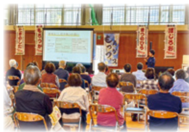
もろつか健康・生きがいくつりフェスタ

る竹の皮はてつきり購入するのかもしれないや、自分や知り合いの竹林で調達すると聞き、購入せずに自然の恵みを上手く生かして調達できるところは諸塚の魅力だなと思いました。 11月はお祭りや文化祭などで皆さんとお話出来ると嬉しいですね。宜しくお願いいたします。