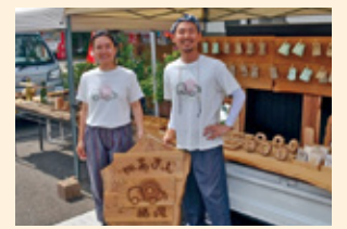
川南軽トラ市での移動販売

任期終了後は現在の個人事業を法人化し、木工や薪づくりの楽しさを体験していただける施設を作りたいです。また、多くのご縁と皆さまのお力添えをいただき人生の伴侶にも恵まれましたので、畑での作物づくりや、ゆくゆくは稲作にも挑戦する予定です。