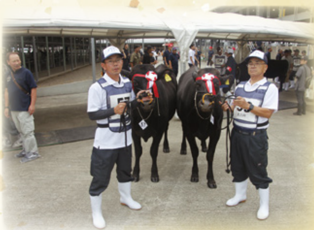
第3類(生後12ヶ月以上22ヶ月未満で同一種雄牛3頭セット)