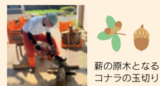
薪の原木となるコナラの玉切り