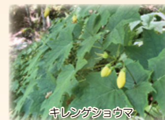
キレンゲショウマ

鹿の食害は年々深刻となり、山頂の周辺は、以前繁茂していたスズタケがほとんど無くなり、ブナやヒメシャラ等の樹木も傷んできています。希少種保護エリアの中にも鹿よけネットが痛んだ隙をみつけて入り込むので3重・4重に重ね、どうにか保護できています。台風災害でアクセスが厳しい中で、登山道・保護エリアの整備にご尽力いただいている地元公民館の皆さん関係事業所の皆さんにこの場をお借りして感謝申し上げます。(諸塚村観光協会)