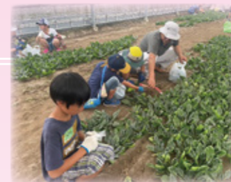
▲園芸団地と椎茸団地で野菜の収穫体験の様子