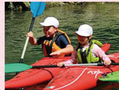
▲バランスをとりながらこぐカヌー (3・4年)

7月は、記録的な猛暑となりました。そうした暑さにも負けず、3・4年生は、水辺調査とカヌー体験、ブルーベリー狩り体験等を実施しました。なかでもカヌー体験は子どもたちが特に楽しみにしていた活動で、冷たい水の中で、暑さを忘れるかのごとく、熱心にパドルをこいでいました。5・6年生は、「ものづくり体験講座」で、寄せ植えづくりを行いました。砂利やこけ、木切れの配置など個性豊かな作品ができあがりました。“来年もやりたい”との声も聞かれました。1・2年生は、音楽科の授業で、「祭り」に関する曲からイメージしたおみこしやお面などの作品を制作しました。どの学年も体験活動にあふれる1学期でした。2学期もご期待!!