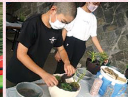
▲個性がきわだつ寄せ植えづくり (5・6年)