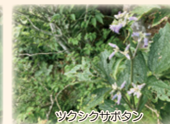
ツクシクサボタン