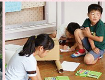
▲曲のイメージからつくる作品 (1・2年)