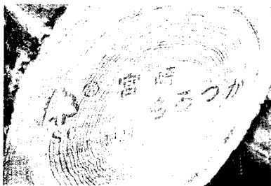
諸塚産材にはFSC森林認証マーク入

の森を守っている林家は、全国的に見ても大規模な組織は少なく、木材価格の低迷や採算性の低さ、産業としての基盤の弱さから徐々に衰退しています。兼業の小・中規模林家の多くが、儲からない山の経営から手を引き、さらにこの数年の暴落によって、大規模林家までもが、山林を伐採し、その後植林しないで山を棄てるという、深刻な「放棄林」が増えていると聞きます。