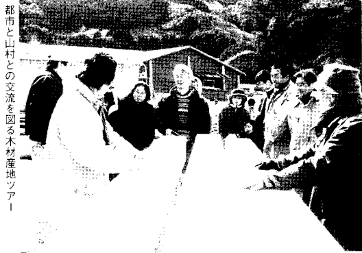
都市と山村との交流を図る木材産地ツアー