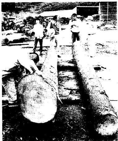
施主による木材検査

しかし、これからの林業にとって環境に優しい森から生産される製品を、一般のユーザーに届けるためには、ユーザーが履歴を識別できる流通にすることは不可欠です。 諸塚村は、年間3万立方メートルを超える原木を生産している日本有数の木材産地ですが、村内のほぼ全木材を森林組合が取り扱っており、しかも自前の木材加工センターによって、製品をダイレクトでユーザーに届けることができます。 森林からユーザーにわたるまでのすべての生産・加工・流通過程で分類表示し、工程管理するシステムであるGOC認証を、諸塚木材加工センターが、昨秋の森林認証取得と同時に取得し、全国トップクラスのFSC認証材製品の生産と流通基地が実現しています。